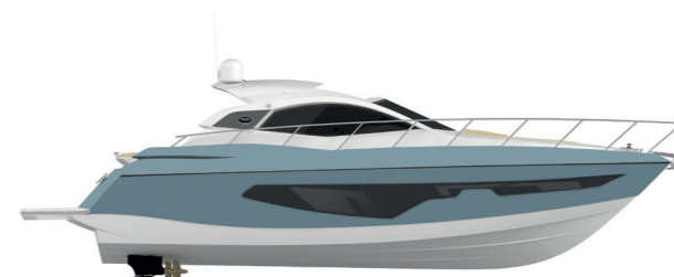
AIR BLUE (paint)