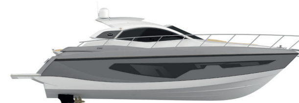
SILVER/GOLD METALLIZED (paint)